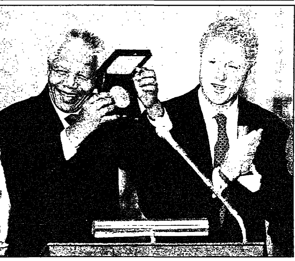
كلينتون في جانب الرئيس جنوب افريقي نيلسون مانديلا يحمل اللقبية الذهبية حصل عليها في الكونغرس امس

■ باريس - اف ب: وقعت خمسون شخصية تقريبا من اوساط الفن والادب والارباب العالمي نداء نشرته صحيفة لوموند الفرنسية أمس تدافع فيه عن الرئيس الامريكى بيل كلينتون الذي يتعرض على حد قولها «منذ ثمانية اشهر إلى تنكيد تصمغي من جانب صحفي متعصب يمتنع بصلاحيات لا حدود لها». وأكد موقعو النداء الذي جاء بمبادرة من رئيس لجنة الشؤون الخارجية في الجمعية الوطنية الفرنسية جاك لانغ ان هذا الحق يخوض في الواقع معركة ايديولوجية متحررا بالاخلاق والقاتون. واصفا ان «خطرا مزموجا يهدد الديمقراطية في الولايات المتحدة ان تم، في تحقيق ستار، انتهاك التوازن بين السلطات والتعرض للحياة الديمقراطية». واصفا «النيابة الاحبارية رجل دولة الا على اعماله العامة واليافي لا اعتبار». وتضمن لجنة المبادرة التي اطلقها وزير الثقافة الفرنسي السابق جاك لانغ الكتاب ويليام ستارلينج والديوان (للجنة) وكارلوس فونتينس (المسكي) وغريغوريت غراس (المانيا) وبرنارد فري ليني (فرنسا) وجانزي جوارن تويل